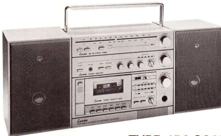
TYPE 150 2011