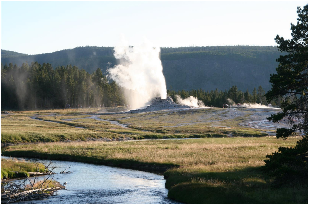
En del har rätt oföretsebara utbrott och här satt folk andsktsfullt väntande.