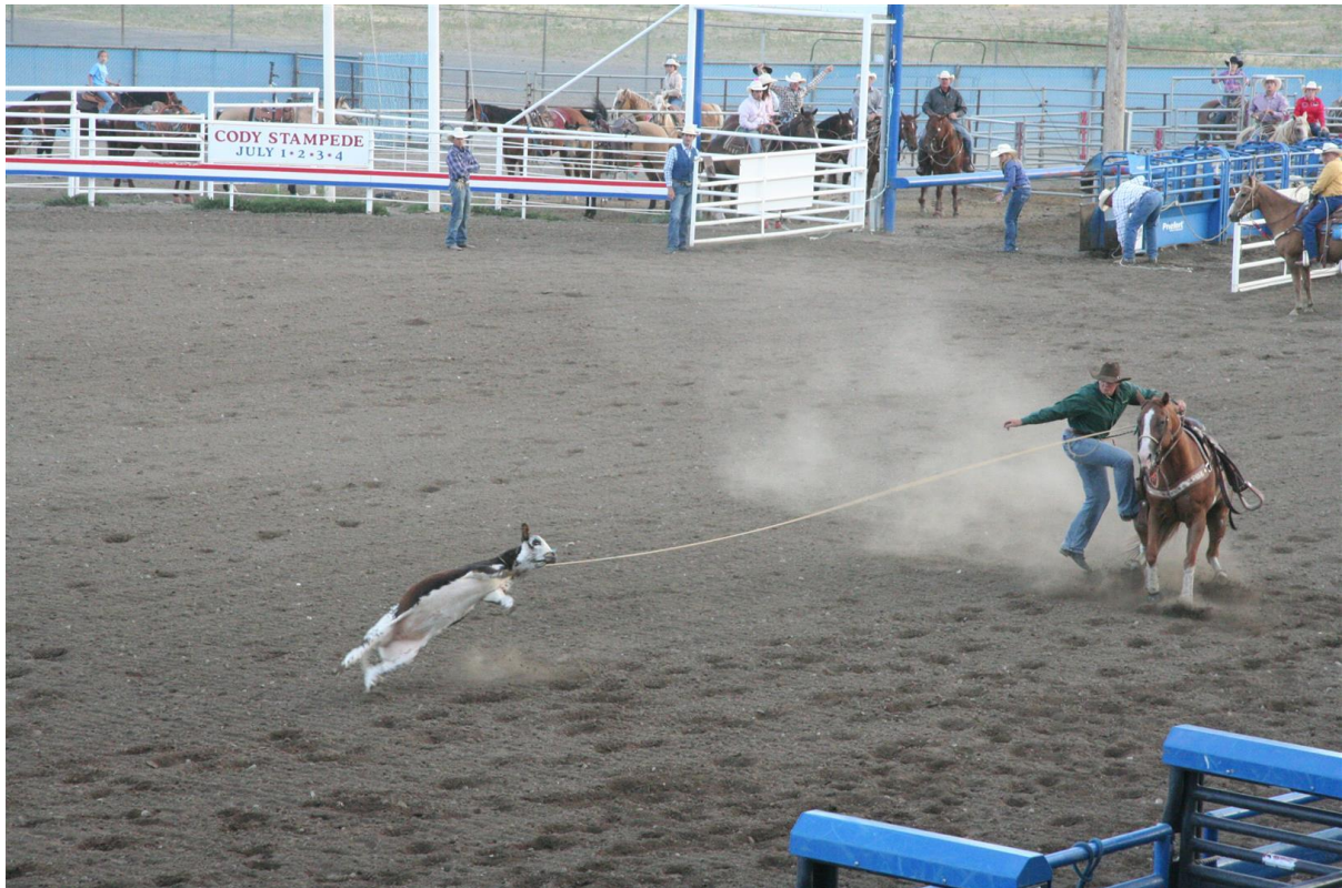
Här blev lite allvarligare.