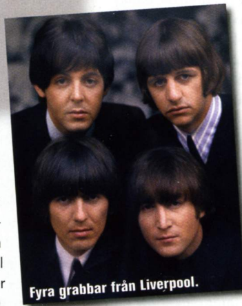
Fyra grabbar från Liverpool.

Ofta framröstad till tidernas bästa platta, vilket fött att många (inte minst kritiker) närmar sig den skeptiskt och överkritiskt. Själv har jag älskat plattan sen den dag den kom ut. Från det makalösa omslaget till andra sidans sista vinylspår ("her majesty's a pretty nice girl..."). Som ung hoppade jag ofta över