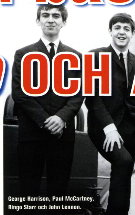
George Harrison, Paul McCartney, Ringo Starr och John Lennon.