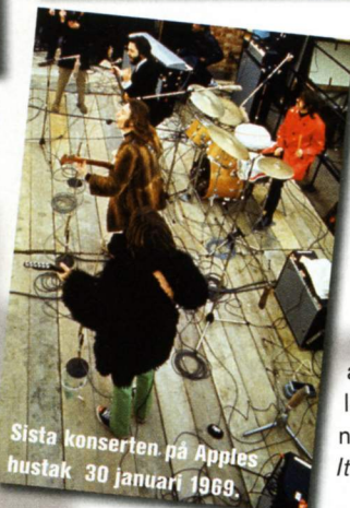
Sista konserten på Apples hustak 30 januari 1969.

Inspelad under osämja, obekväma förhållanden och med filmkamerors distrahnerande närvaro. Disharmonin ligger över spåren – även om nostalgiska Two Of Us är ett försök att ge den fingret. Känns ofärdig, även om här finns balladguld som