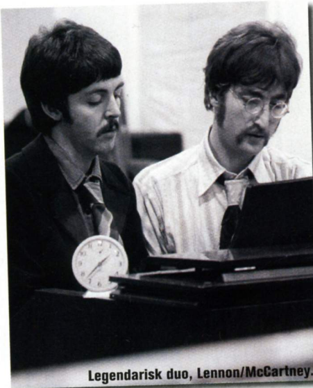
Legendarisk duo, Lennon/McCartney.