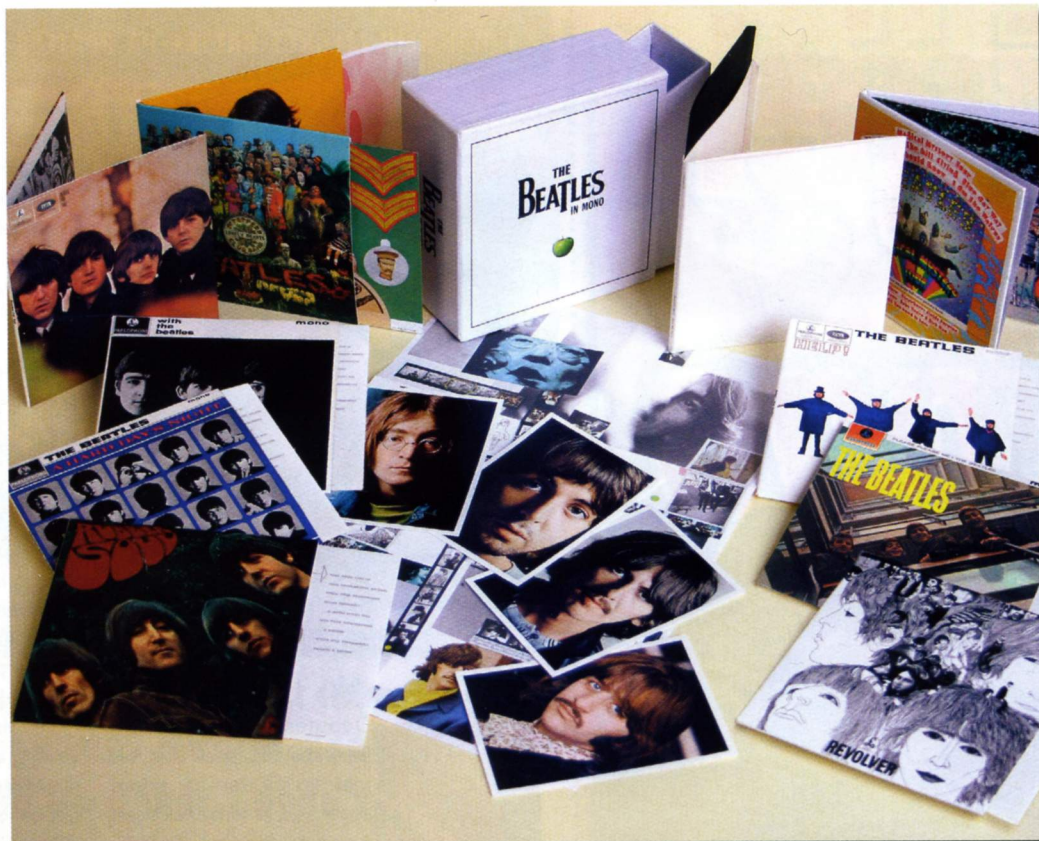
Den kostsamma och starkt begränsade monoboxen är tillverkad i Japan och är gjord som exakta replikor av originalsivorna.